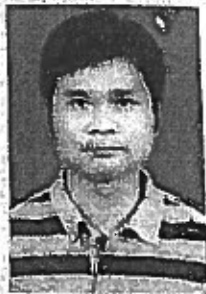
(加盖公章机关钢印有效)